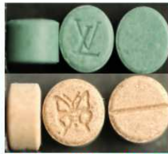
MDMA、MDA、PMMA 等安非他命類毒品