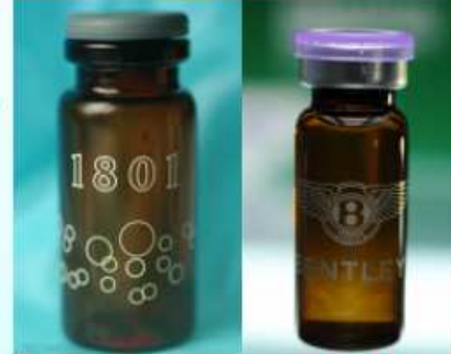
Mephedrone (喵喵)、 bk-MDMA、MDPV (浴鹽) 等安非他命類毒品