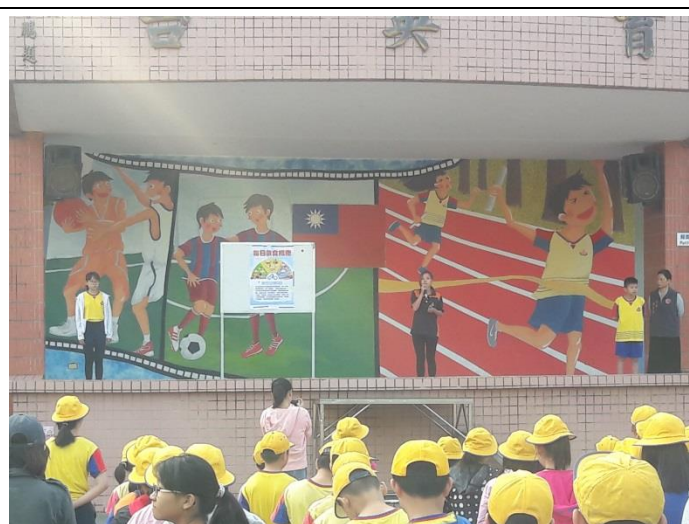
108/10/21 兒童朝會午餐教育