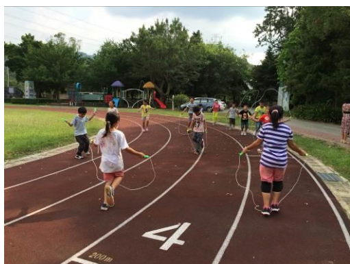
說明：課間活動跳繩。