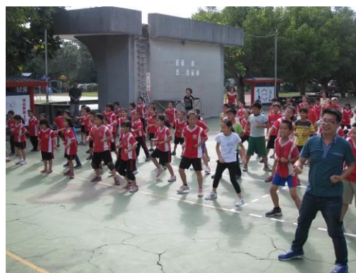
說明：課間活動護眼操。