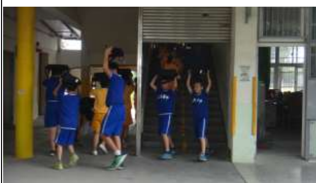
說明：以書包保護頭部