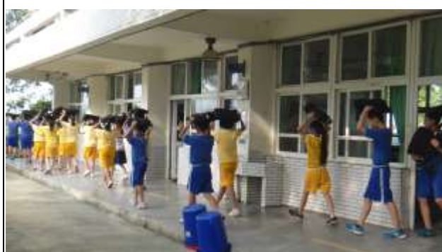
說明：演練逃生路線