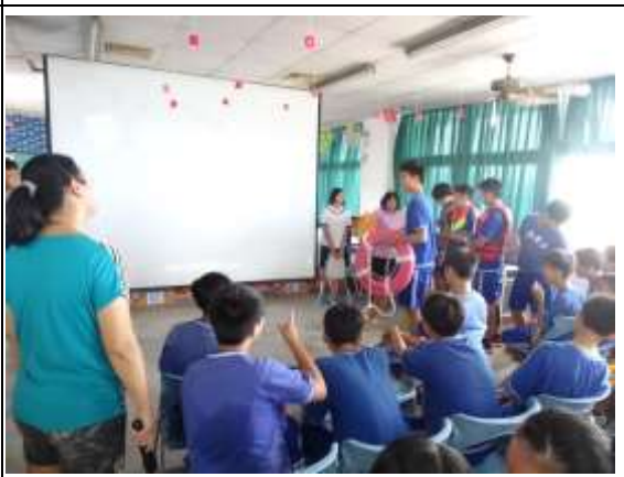
說明：救生圈使用教學