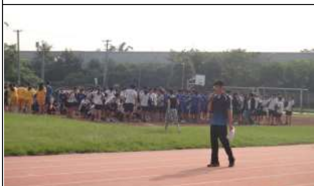
說明：至空曠處集合