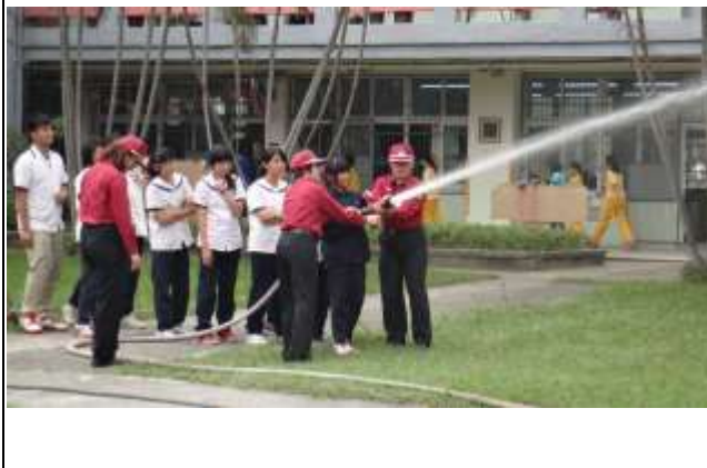
說明：消防栓使用教學