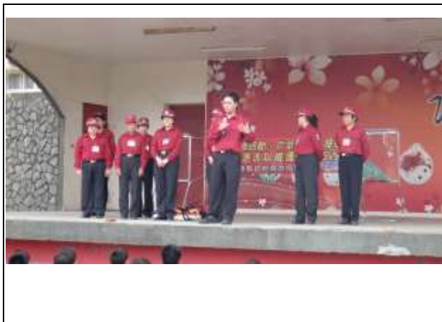
說明：消防局頭份鳳凰志工分隊