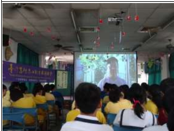
說明：觀看宣導短片