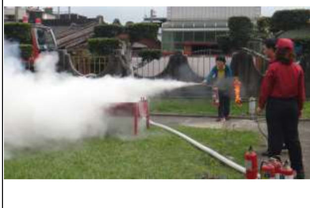
說明：滅火器使用教學