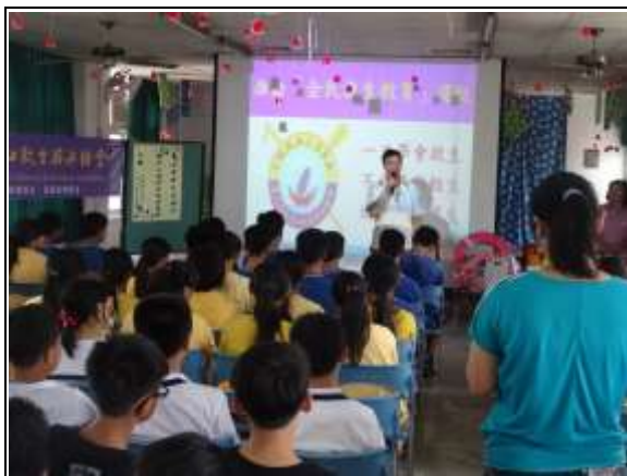
說明：主任開場介紹