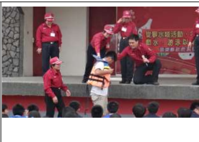
說明：救生衣穿法教學