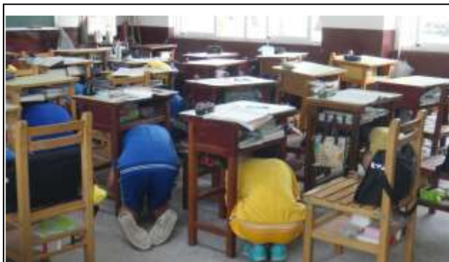
說明：地震來時就地找掩護