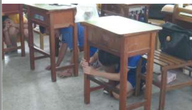
說明：抓穩保持平衡