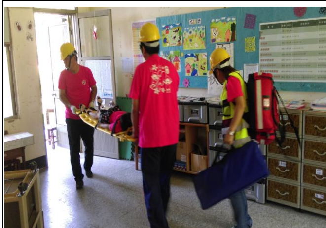
說明：傷患獲得救援聯絡救護車到校送醫