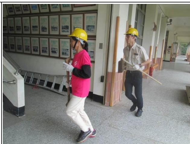
搶救班組員帶著搶救工具進入校園