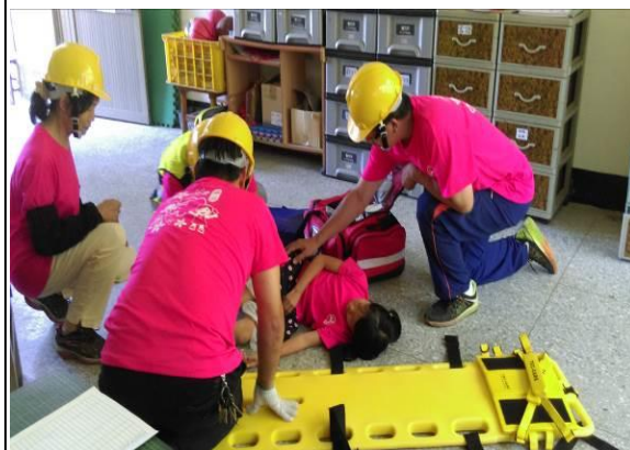
說明：搶救班組員進入教室搶救受傷學生