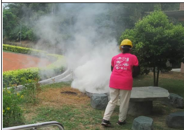
說明：因地震引起火災，立即以滅火器撲滅