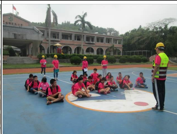
說明：指揮官進行震後心靈安撫輔導