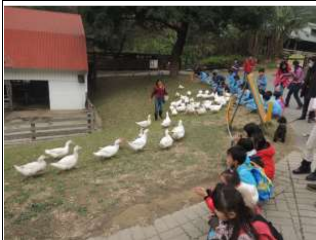
說明： 來牌排隊欣賞鴨寶寶表演喔