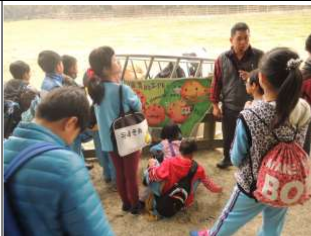
說明： 乳牛生態解說與身體構造說明