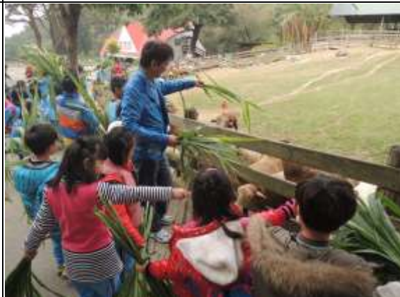
說明： 體驗活動—餵小牛吃草