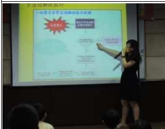
說明： 演練前進行演練方式說明