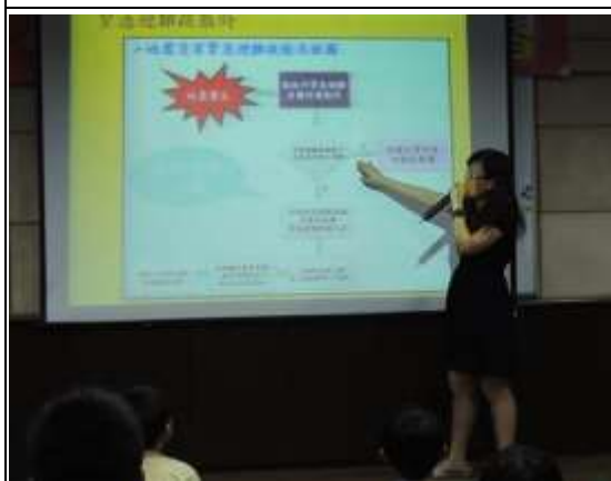
說明： 演練前進行演練方式說明