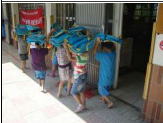
說明： 地震稍停立刻進行疏散