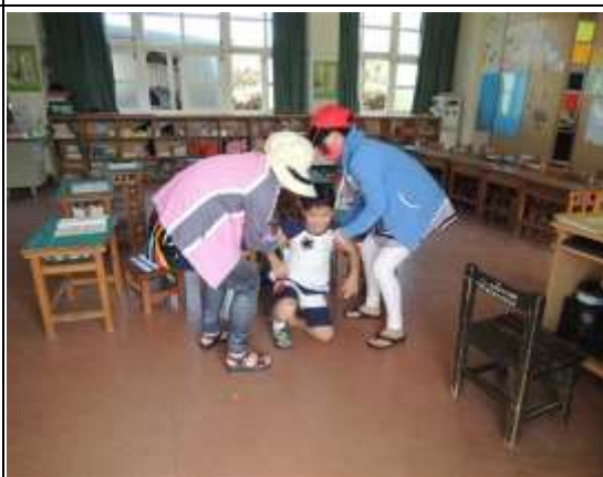
說明： 緊急救護演練