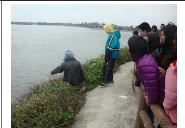
說明： 校長親自說明海岸植物的特點與生長期