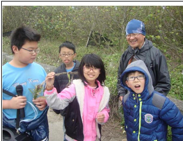
說明： 我們發現可愛的石龍子唷