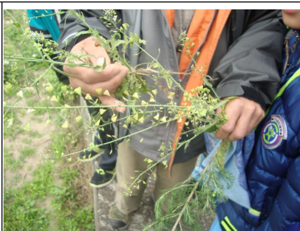
說明： 校長為大家解說植物特徵