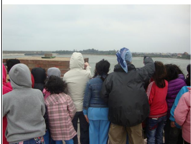
說明： 後龍溪出海口生態說明