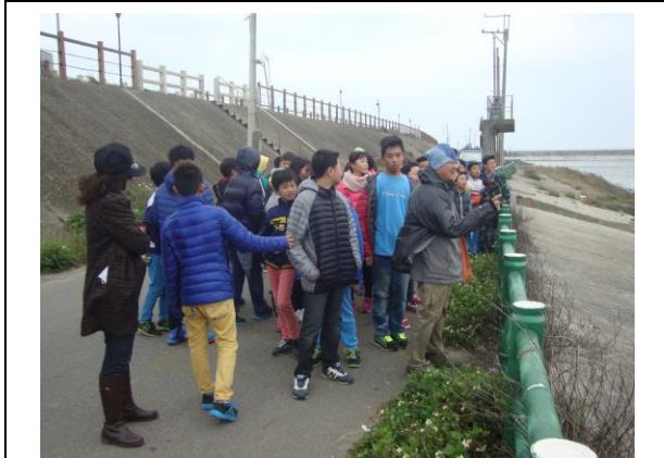
說明： 海岸生態系解說