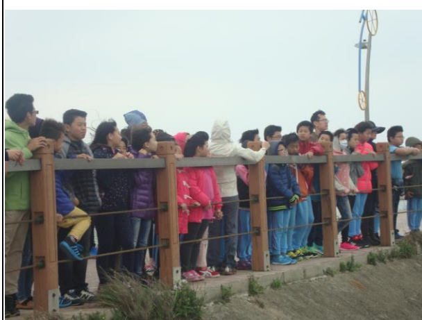
說明： 大家一起聆聽後龍溪的歷史，改道的歷程