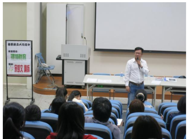
說明：環境教育宣導照片。