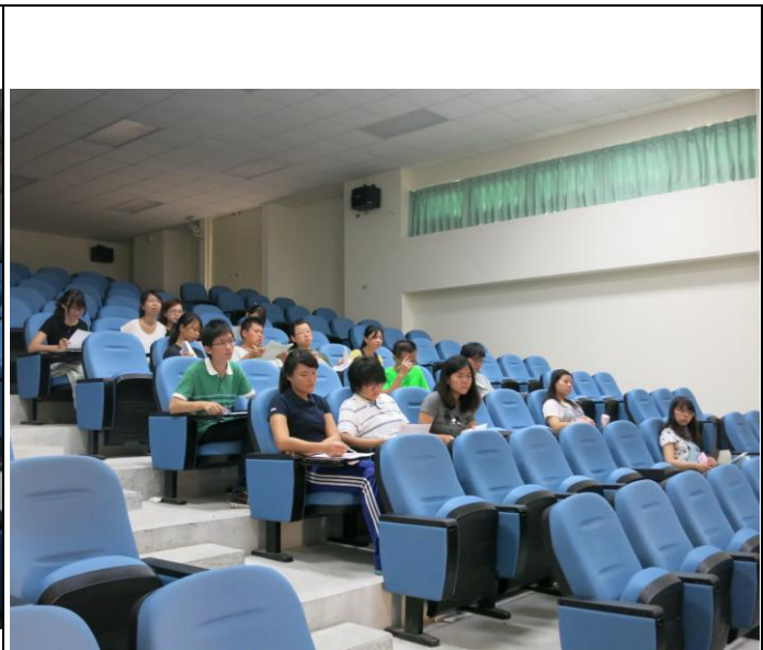
說明：環境教育宣導照片。