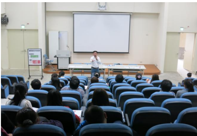
說明：環境教育宣導照片。