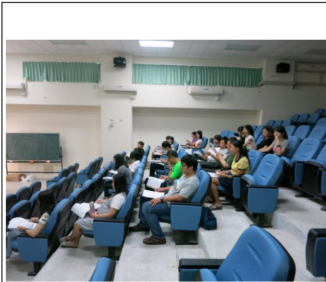
說明：環境教育宣導照片。