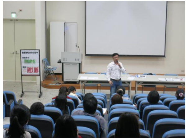
說明：環境教育宣導照片。