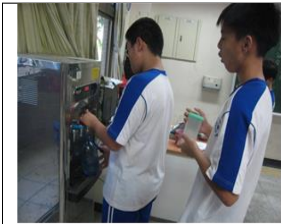
說明：同學班級取水方便