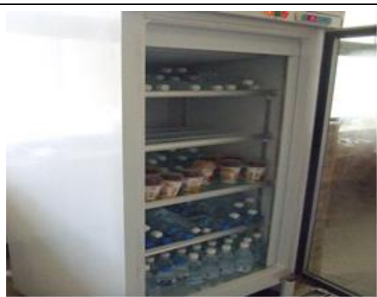
說明：合作社販賣物