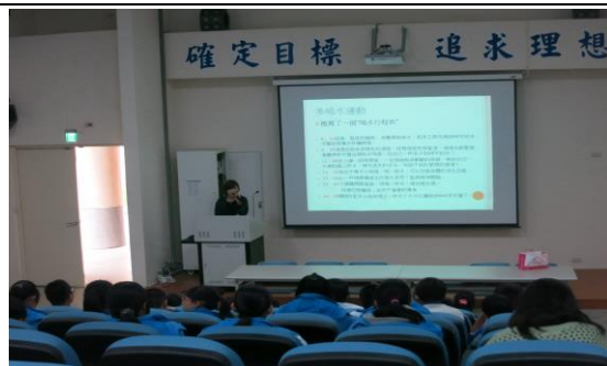
說明：護理師宣導多喝水