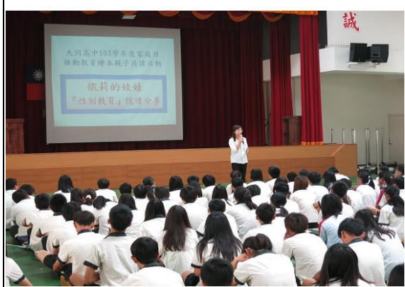
說明：親子共讀融入性教育議題