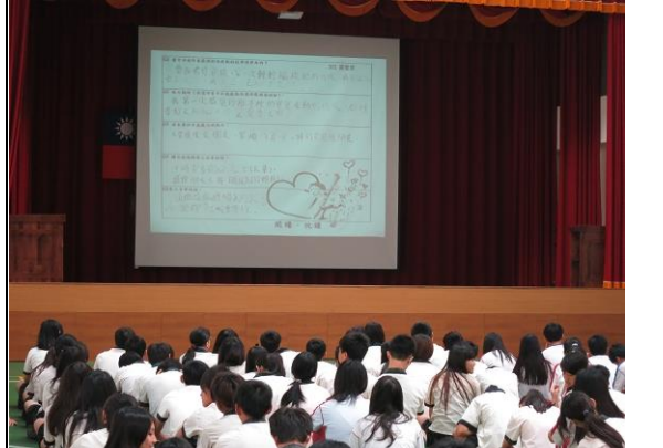
說明：親子共讀分享會