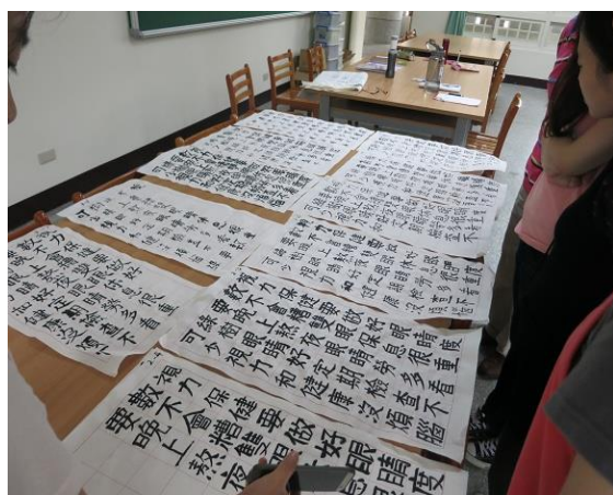
說明：健康促進議題融入國語文競賽(國)