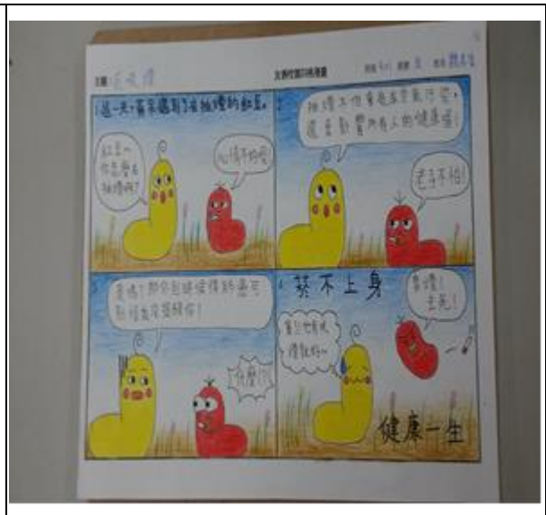
說明：結合有友善校園活動四格漫畫比賽