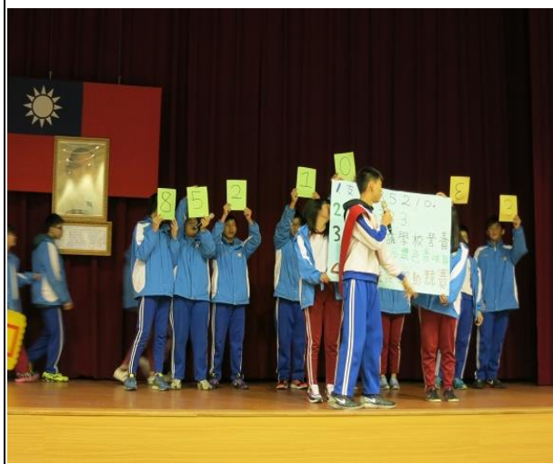
說明：健康大使選拔話劇