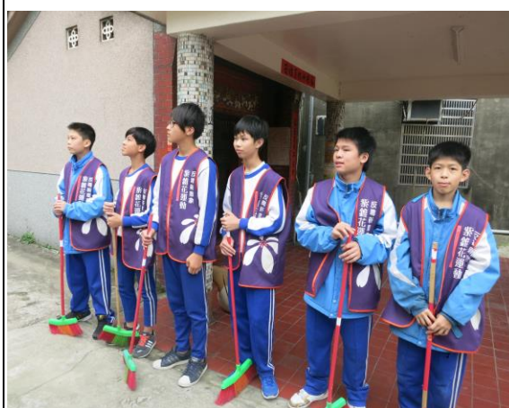
說明：結合紫錐花活動打掃社區菸蒂