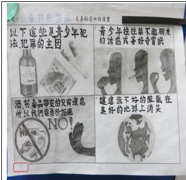
說明：結合有友善校園活動四格漫畫比賽