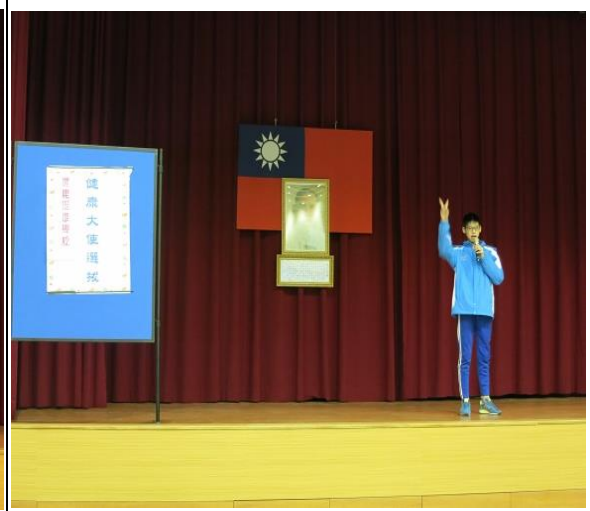
說明：健康大使選拔衛教宣導