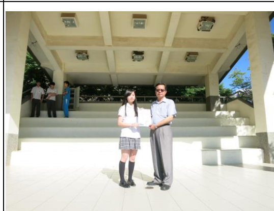
說明：頒發健康大使證書