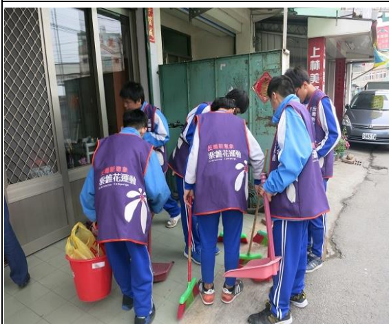
說明：結合紫錐花活動打掃社區菸蒂