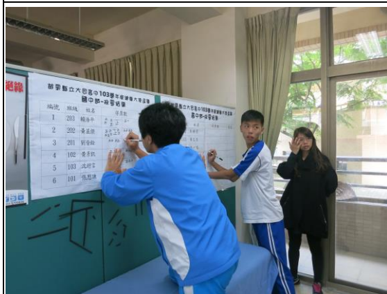
說明：健康大使選拔-開票作業