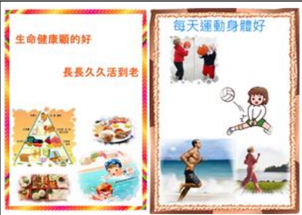
說明：「資訊課」學生利用「非常好色」軟體製作有關健康促進議題之海報