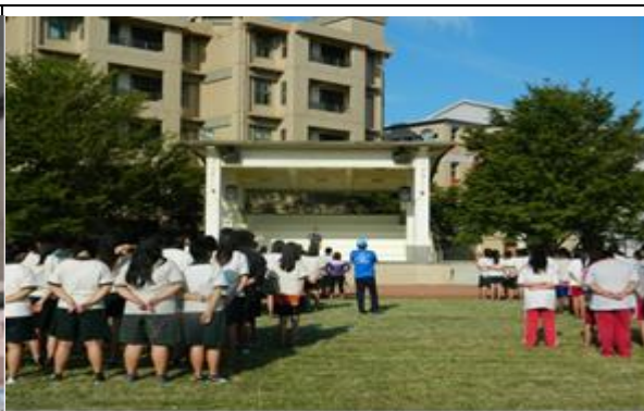
說明：集會宣導健康飲食與健康體能之重要性