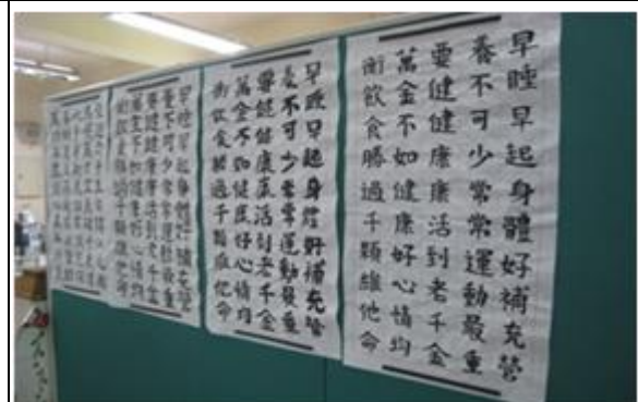
說明：國文領域融入教學辦理書法比賽及作文比賽