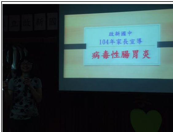
說明：病毒性腸胃炎宣導