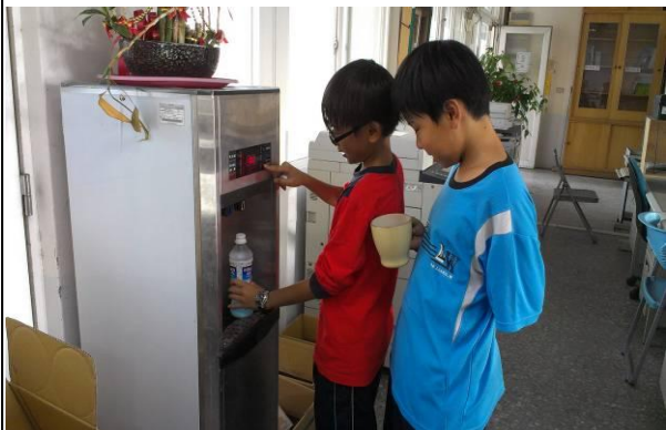
說明：學生下課飲水實況