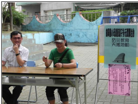
說明：防災教育闖關關主已準備就緒。