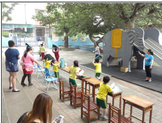
說明：保護頭部為首要工作。