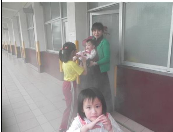
說明：親子一起闖關。