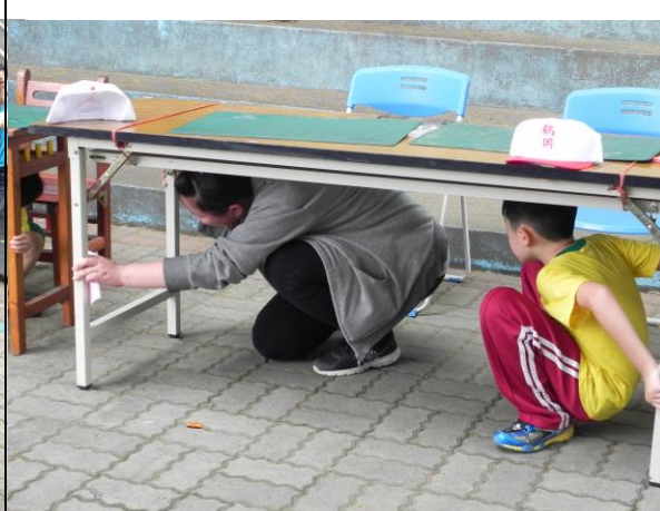
說明：防震演練大家一起來。