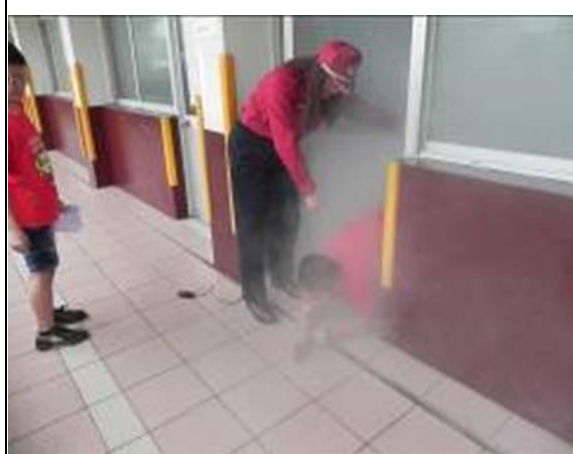
說明：煙霧體驗室，體驗火災逃生方法。