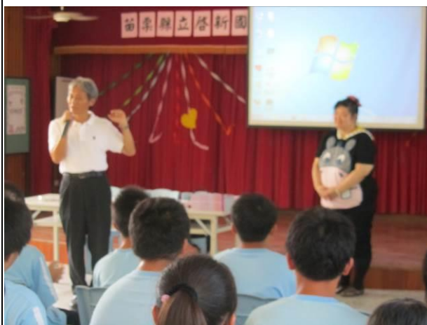
說明：得勝者-校長介紹講師