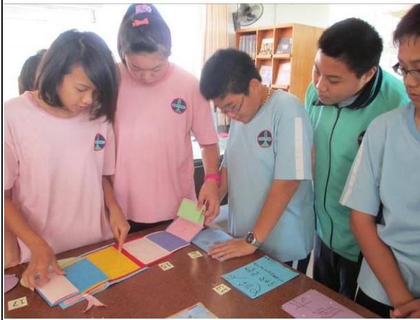
說明：教師卡-同學觀摩