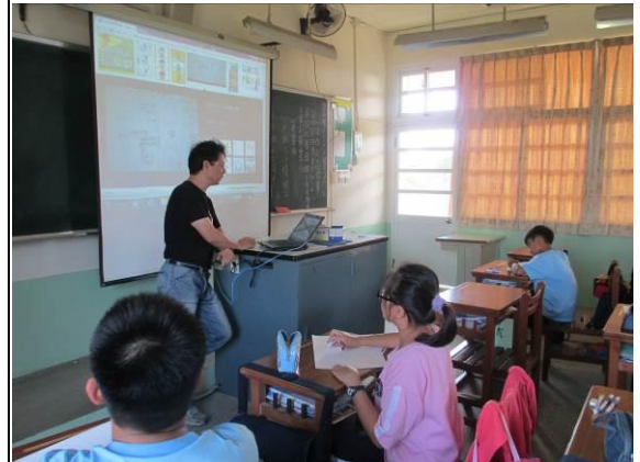
說明：四格漫畫-主題講解