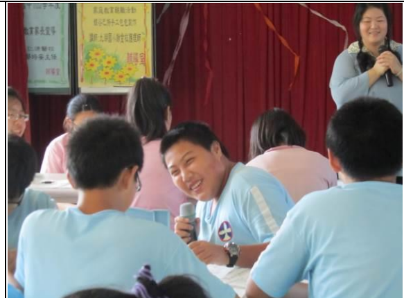
說明：得勝者-學生發表