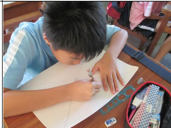
說明：四格漫畫-學生創作