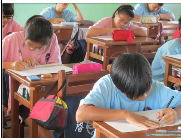
說明：四格漫畫-學生創作