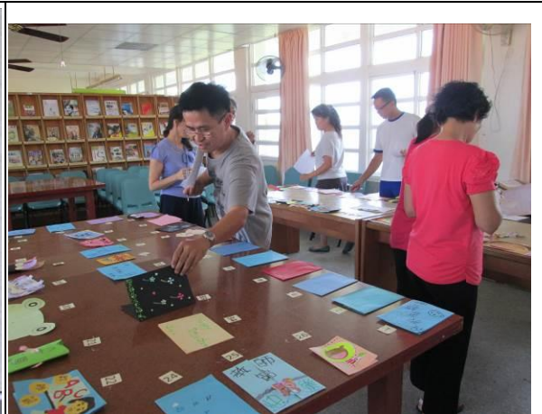
說明：教師卡-教師評選