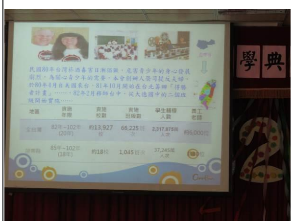
說明：得勝者-課程資料