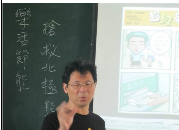
說明：四格漫畫-主題講解