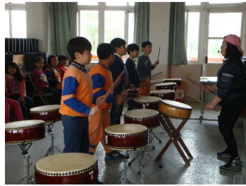
說明：太鼓敲擊，練習正確姿勢避免受傷。