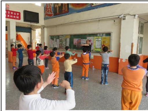
說明：練武練心，每堂課開始、結束前感謝教練教導。