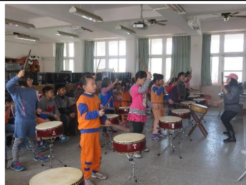
說明：一舉手、一投足都是有要求，讓學生學習有所依據與目標可遵循。