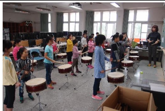
說明：跟隨整體腳步學習敲擊旋律與聆聽他人節奏快慢。