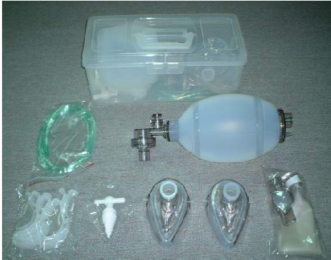
圖一 攜帶式人工甦醒器