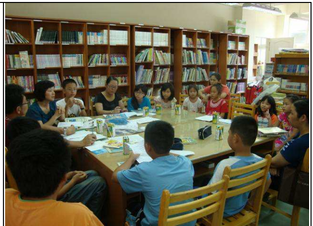
說明：大家輪著發表最近所看的書籍心得。