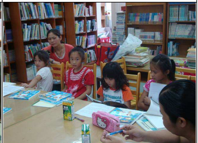
說明：宜臻雖然只有二年級，但常是主動發表感想，而且閱讀筆記內容充實。