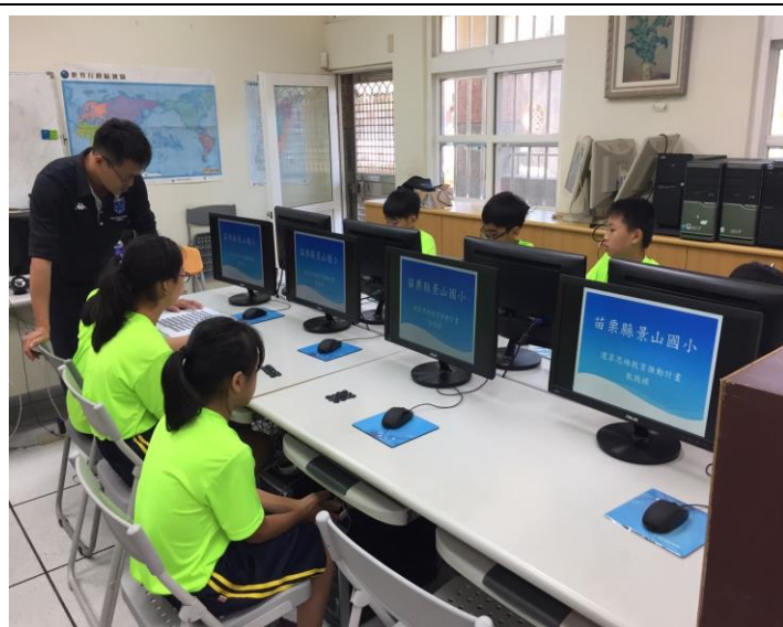
數戰棋桌遊操作解說