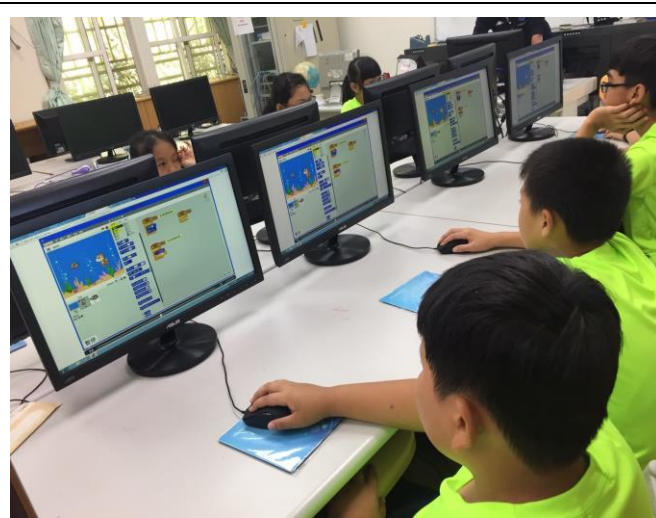
Scratch 2.0 課程解說及實作