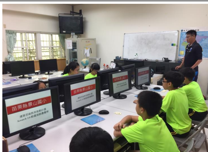
Scratch 2.0 介紹