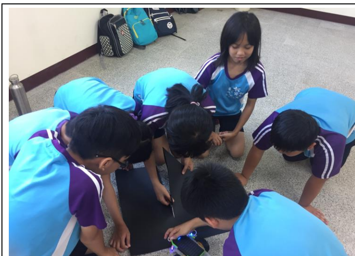
循跡自走車操作前小組討論