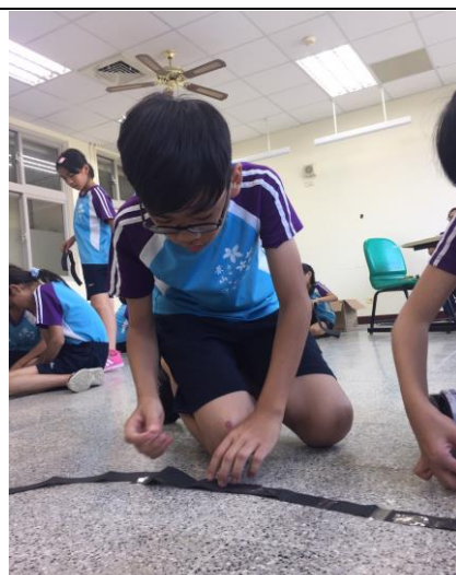
循跡自走車製作及實作測試