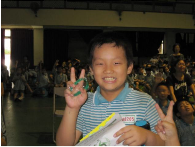
小朋友得到獎品興奮的表情