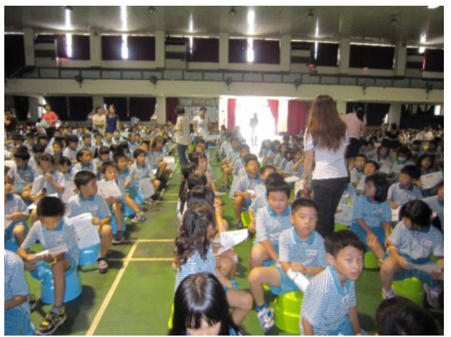
小朋友認真聆聽，記錄學習重點