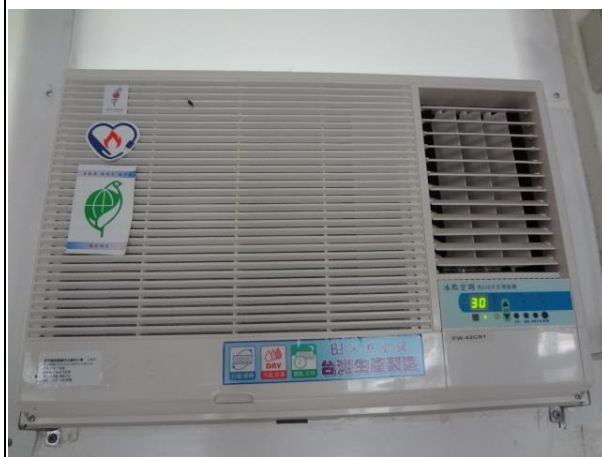
說明：老舊冷氣汰換節能標章新冷氣