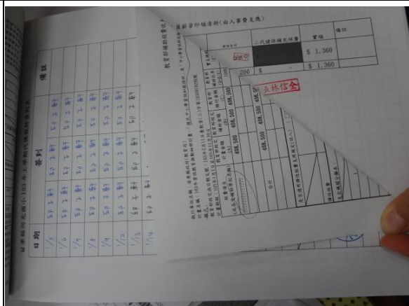
說明：列印皆採雙面列印