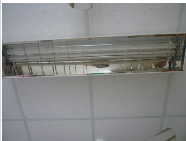
說明：所有班級教室、專科教室、行政空間採用 T5 省電節能燈管