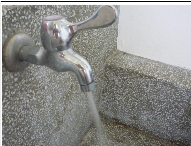
說明：水槽的水龍頭加裝省水的節水閥