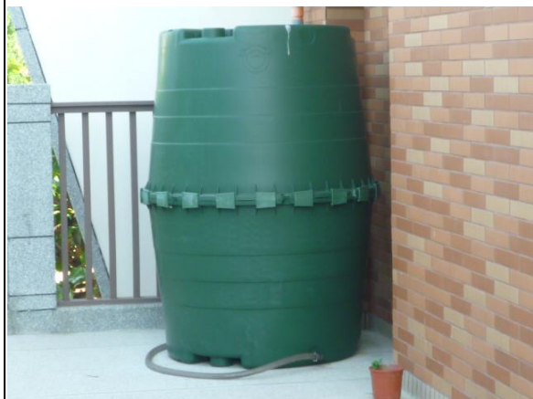
說明：二樓自然教室旁的雨水回收槽